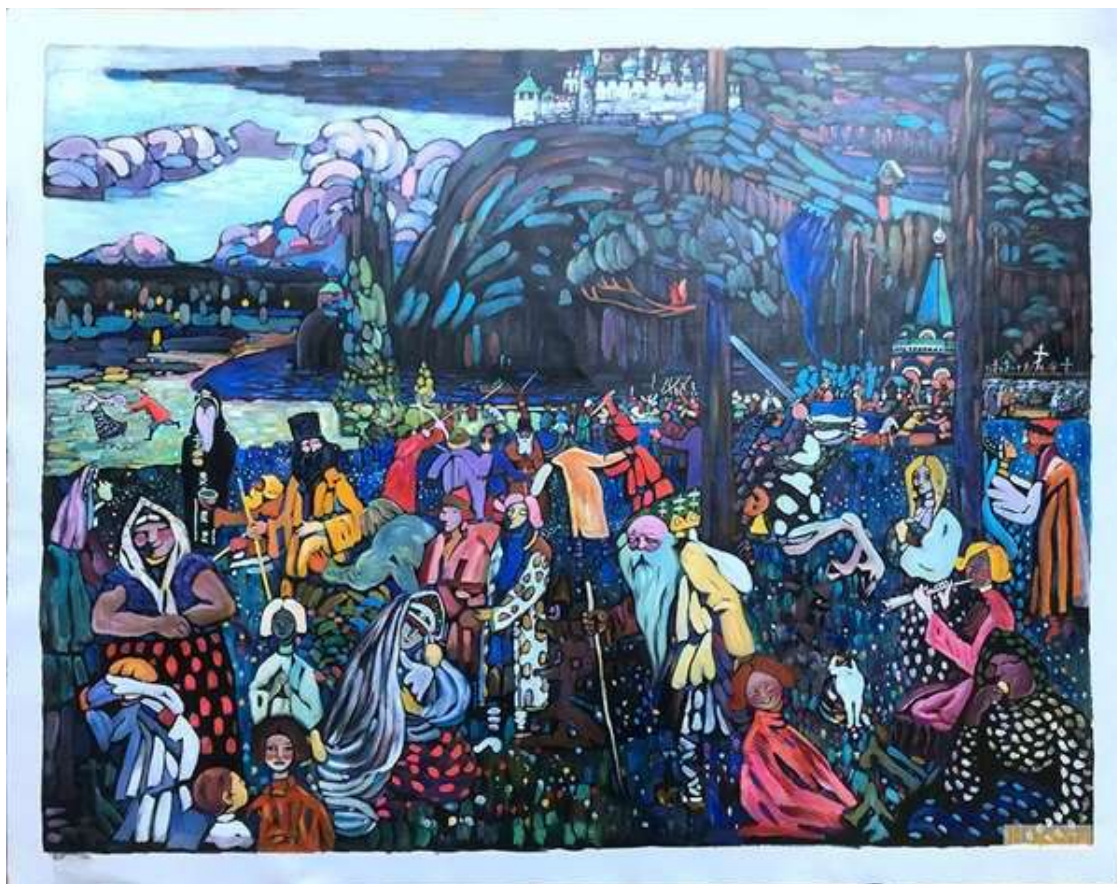
Vasilij Kandinskij- A Motley Life 1907

“Costruire luoghi di autentica amicizia civica.”